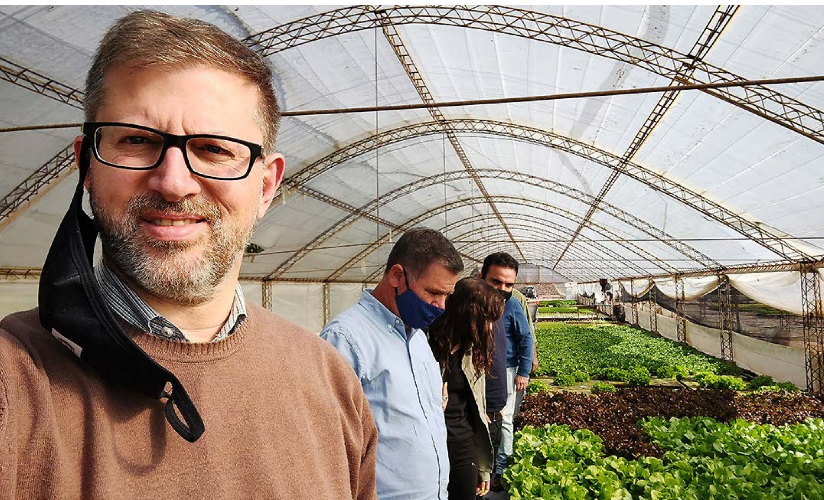
Huerta hidropónica Sol Verde, Maipú (mayo '21)

Participé en el tratamiento de la Ley Mendoza Activa Eficiencia (2022), orientada a promover inversiones productivas mediante incentivos fiscales vinculados a mejoras en eficiencia energética, hídrica y procesos agroindustriales . La iniciativa se inscribe en una lógica de modernización productiva para reducir costos y mejorar la competitividad de las empresas mendocinas.