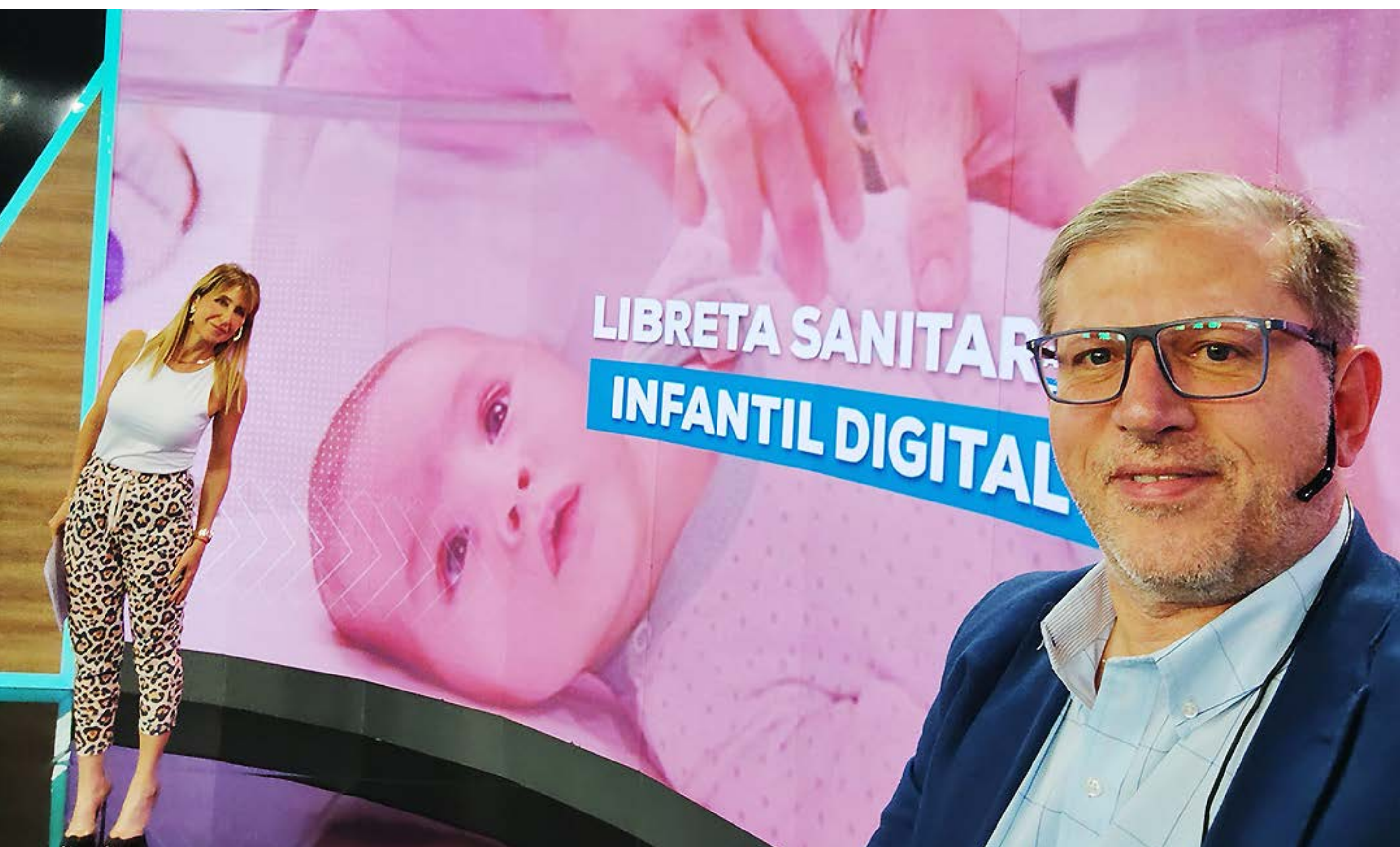
Difusión Proyecto Libreta Salud Infantil Digital en Canal 9 (septiembre '24)

En materia deportiva, impulsé la modificación de la Ley Provincial del Deporte N° 6.457 para actualizar su funcionamiento, fortalecer el apoyo institucional y mejorar estándares de transparencia. En la misma línea, presenté la Ley Anti Barrabravas , incorporando tipificación de conductas y herramientas para prevenir la violencia en espectáculos deportivos.