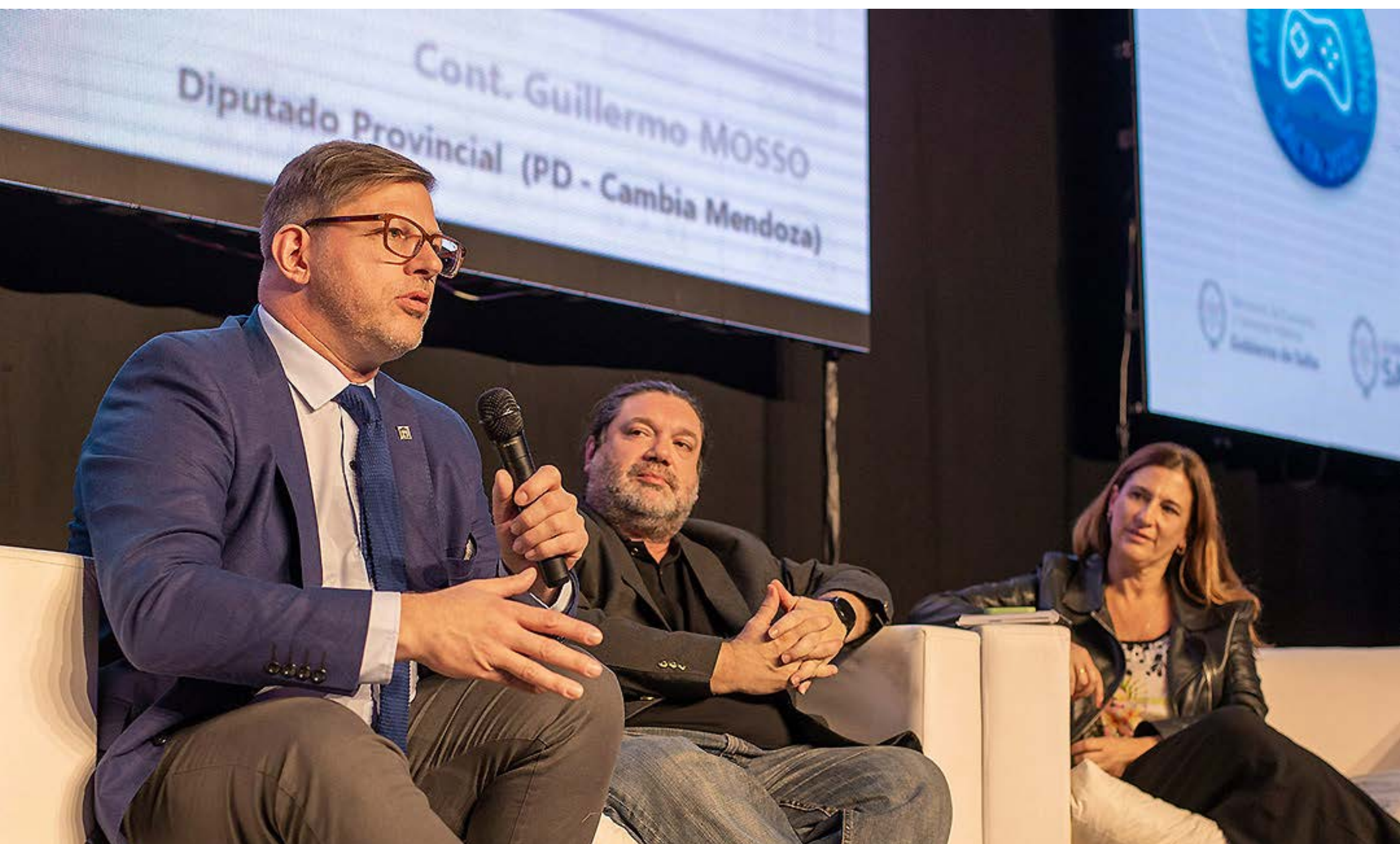
Encuentro Economía del Conocimiento Salta (diciembre '22)

Asimismo planteé la creación de la Mesa Provincial de Conectividad como ámbito de coordinación de políticas públicas, para optimizar el despliegue de infraestructura digital, promover el uso compartido de redes y mejorar el acceso a servicios. Complementariamente, presenté un