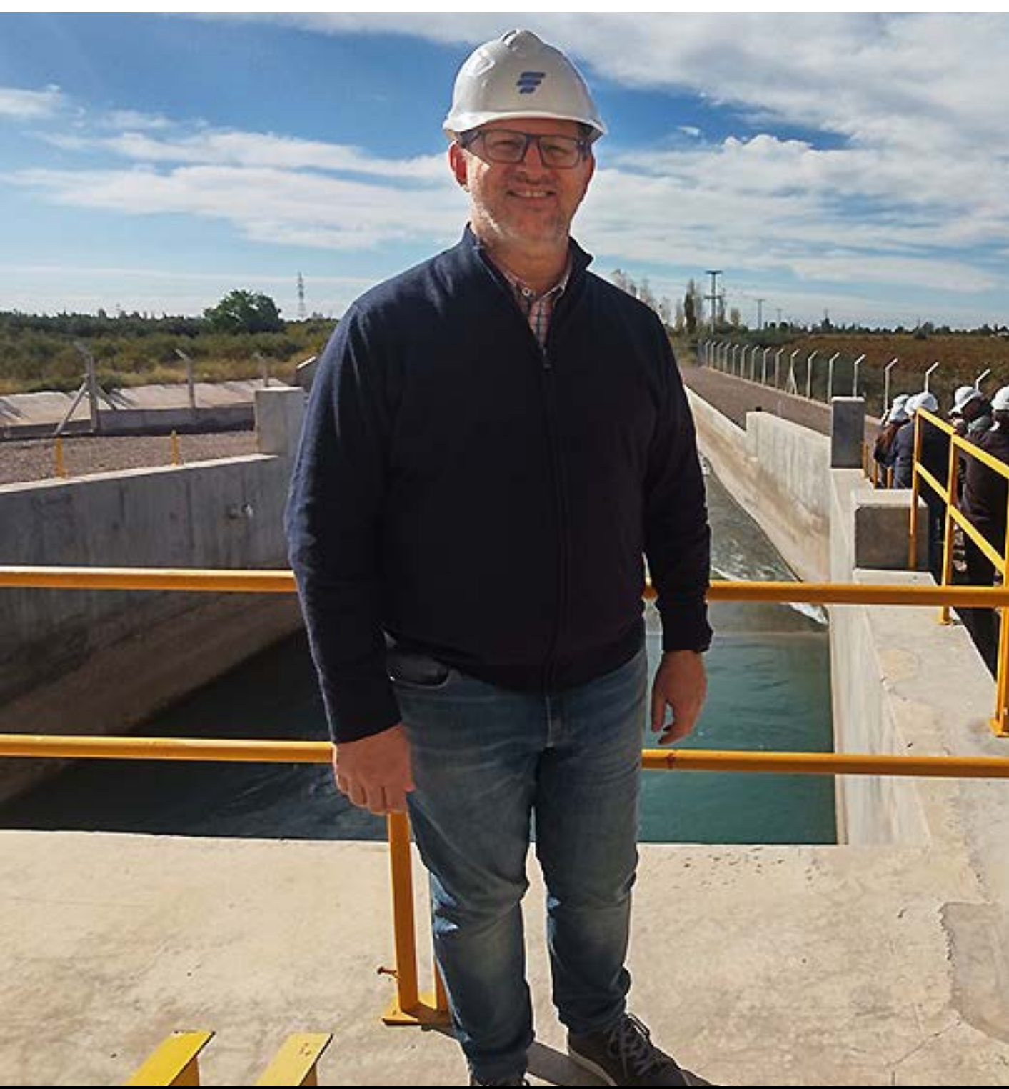
Pequeño aprovechamiento hidroeléctrico Lunlunta (julio '25)

También intervine en el debate de la Ley Mendoza Activa Hidrocarburos (2020) , orientada a sostener la actividad durante la pandemia.