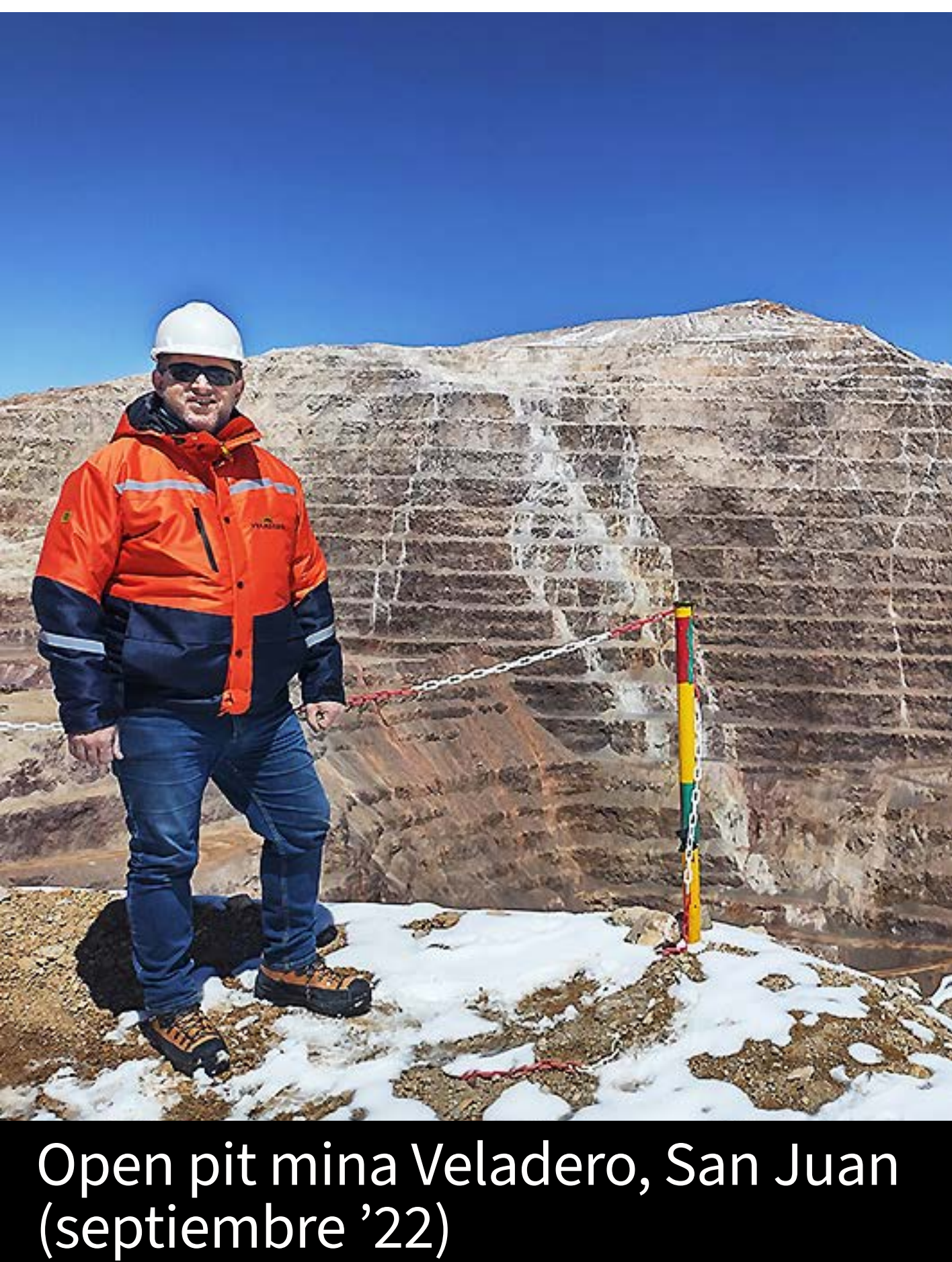
Open pit mina Veladero, San Juan (septiembre '22)

En ese marco, asumí un rol activo en el tratamiento de iniciativas vinculadas a la actividad, interviniendo como miembro informante en proyectos de exploración como Cerro Amarillo, Malargüe Distrito Minero Occidental 1 y 2 , y de explotación como PSJ Cobre Mendocino . También participé en debates orientados a generar mejores condiciones para la inversión, como la adhesión de Mendoza al Régimen de Incentivo a las Grandes Inversiones ( RIGI ), y a estándares de transparencia como la iniciativa EITI , que promueve la publicación de información sobre ingresos, producción y gestión en industrias extractivas.