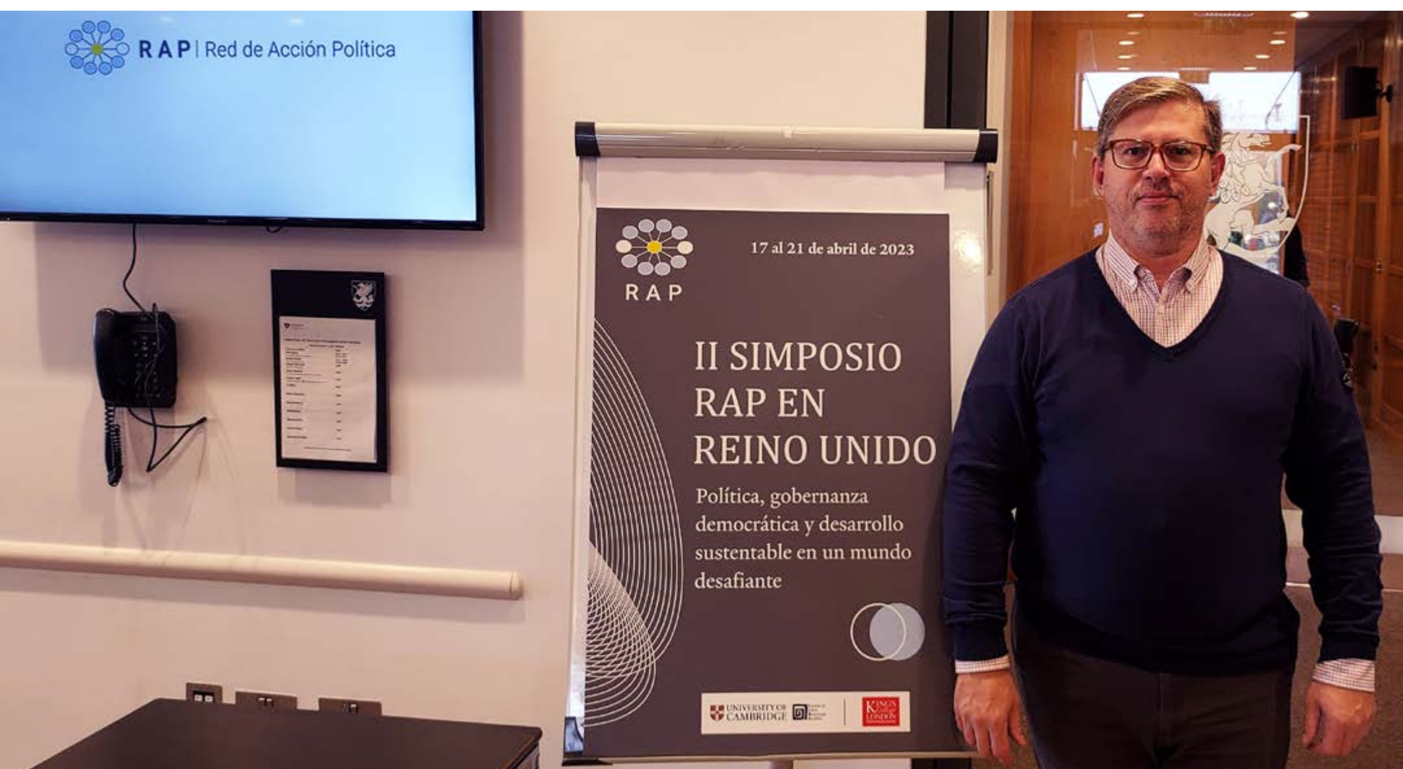
Seminario RAP en Londres y Cambridge (abril '23)

Tras la primera vuelta y conocida la derrota electoral, Patricia tomó en pocas horas una decisión de fuerte impacto político: respaldar en el balotaje a Javier Milei, sin especulaciones , lo que juzgué como un gran acto de responsabilidad.