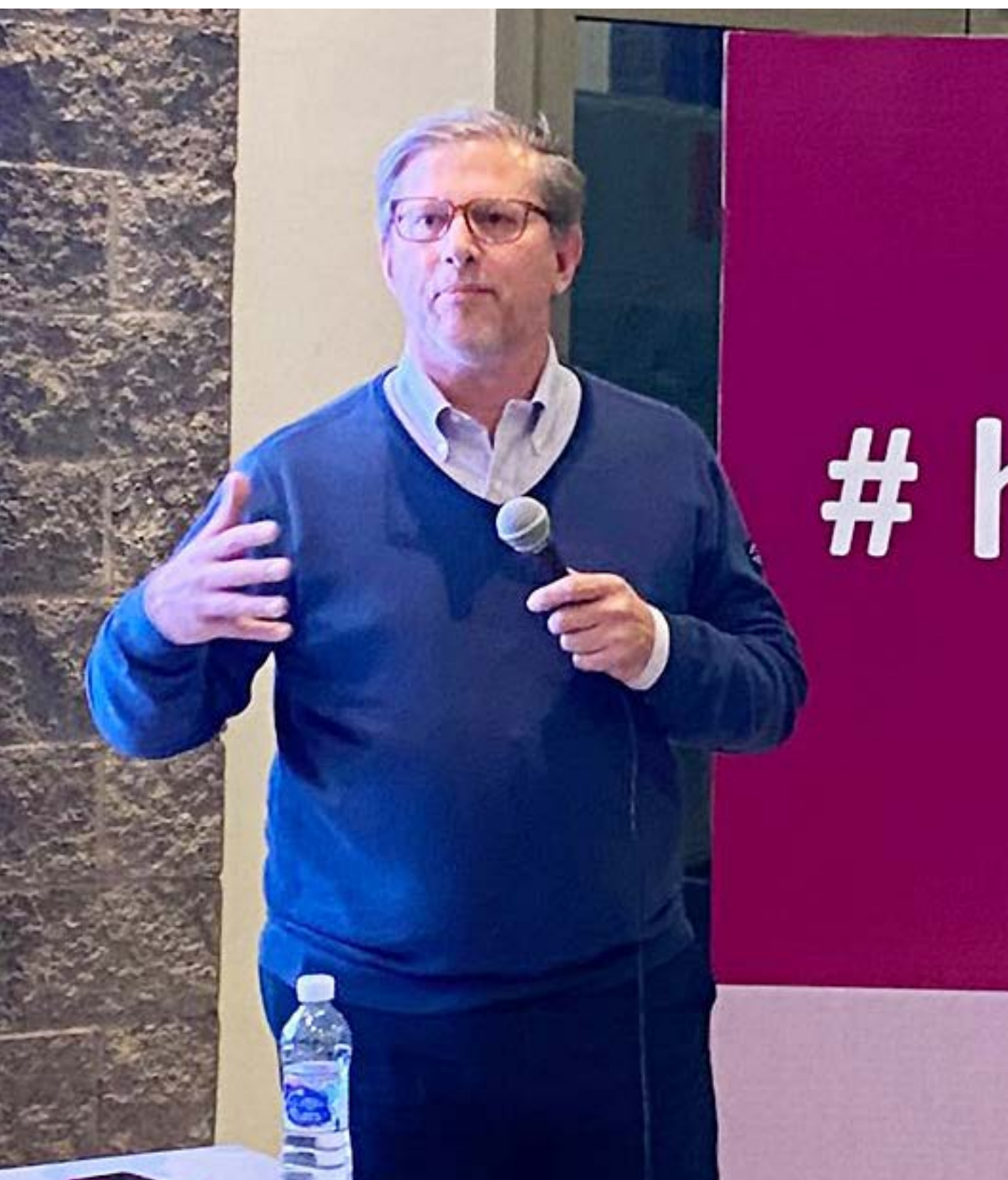
Charla Industria 4.0, Parque Industrial Las Heras (mayo '23)

de empleo exportable. Expuse sobre conectividad ante la Cámara Argentina de Pequeños Proveedores de Internet (CAAAPÍ) , abordando desafíos estructurales y políticas públicas para mejorar la infraestructura digital.