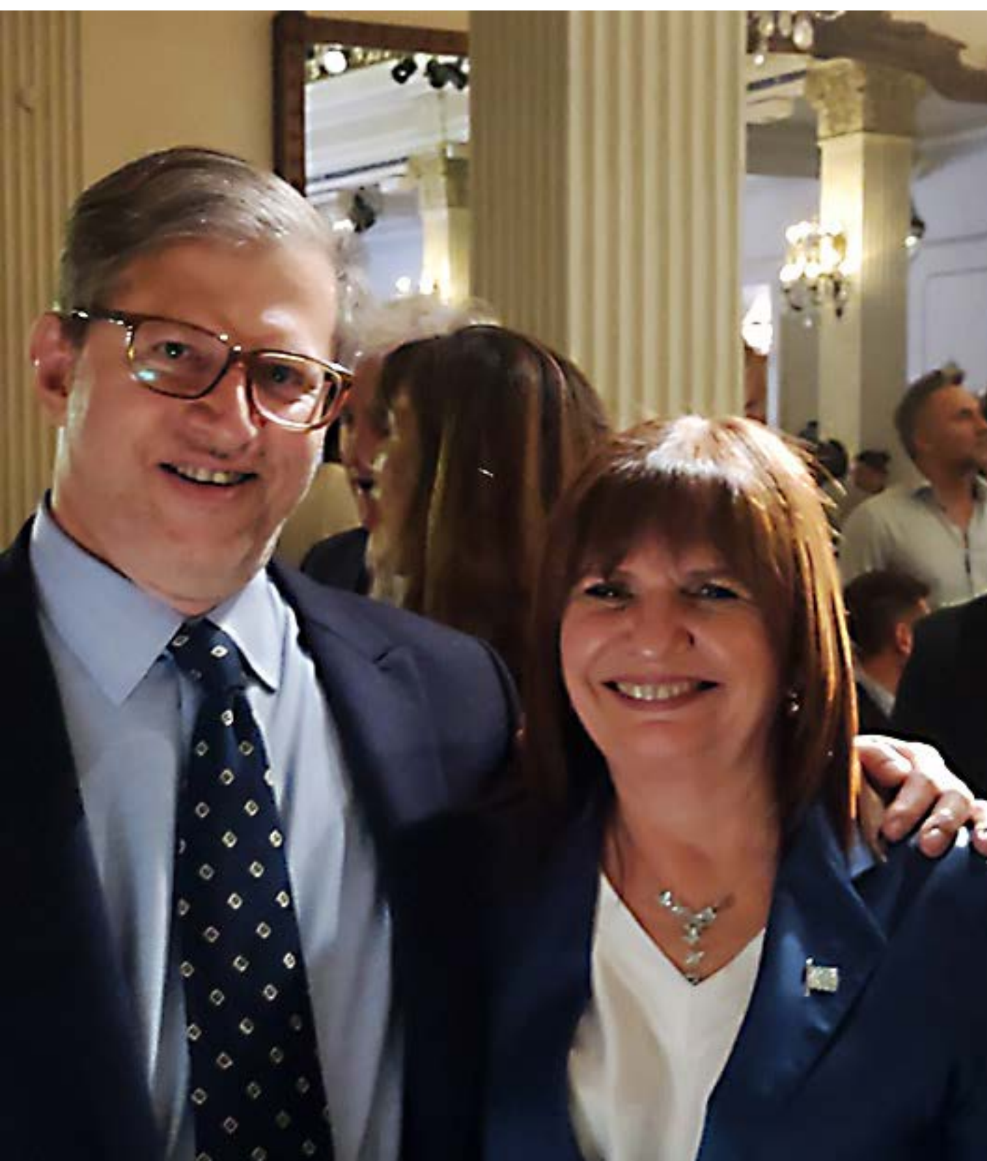
Cena Recaudación de Campaña (noviembre '23)

Mi ingreso a la vida legislativa fue el resultado de un proceso que comenzó en 2017, cuando integré la lista de candidatos y quedé a menos de 2.000 votos de acceder a una banca en la Legislatura. En 2019 asumí como diputado provincial tras la renuncia de un legislador. En ese momento formaba parte del frente Cambia Mendoza, representando al Partido Demócrata , espacio en el que había desarrollado toda mi militancia política desde joven.