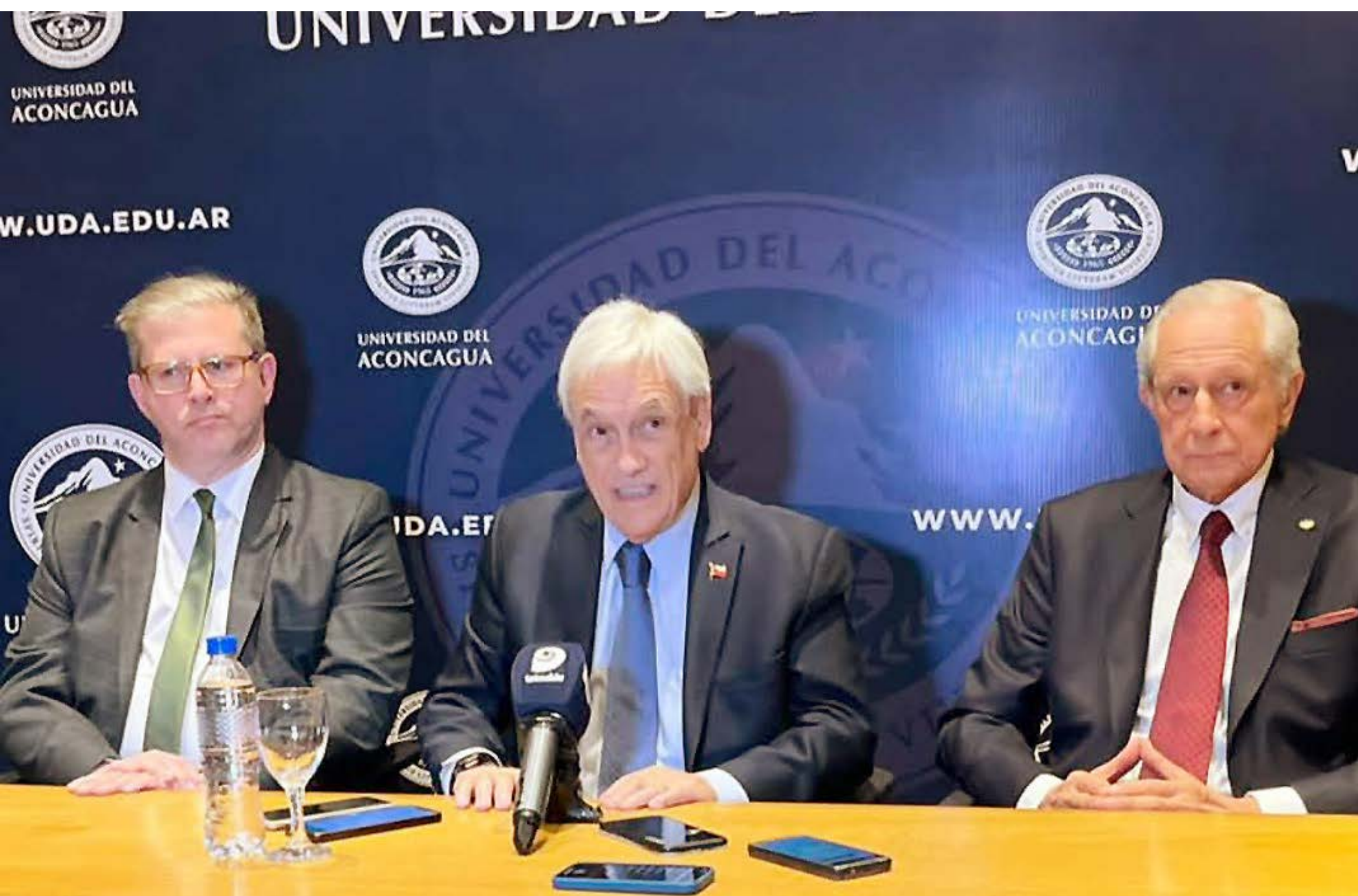
Doctorado Honoris Causa a Sebastián Piñera (septiembre '23)

Líderes por la Democracia y la Libertad , donde se debatió sobre institucionalidad, libertades y escenarios post-COVID.