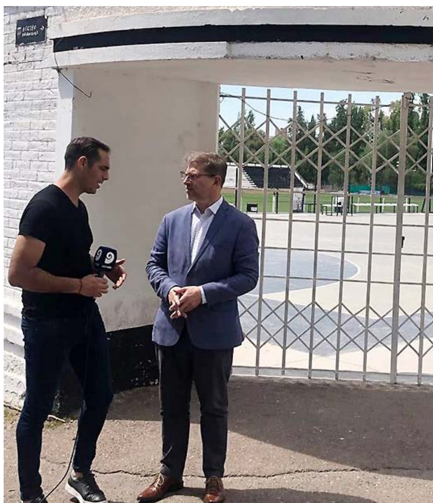
Proyecto de Ley Anti Barrabravas en Canal 9 (octubre '21)