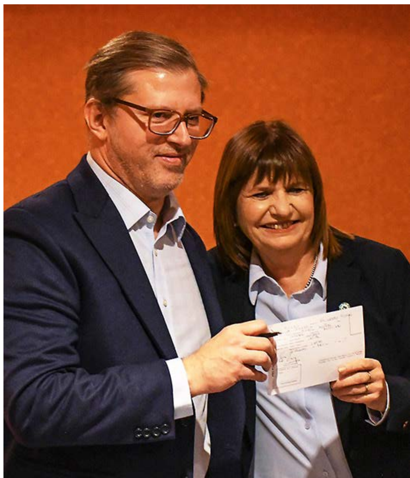
Acto de Afiliación al PRO (junio '23)

Con el tiempo surgieron diferencias políticas relevantes con el PD respecto del posicionamiento frente al gobierno provincial, en un contexto de administración nacional kirchnerista. Consideré que el camino no era la oposición a esa construcción local, sino sostener una visión orientada a la gobernabilidad y al desarrollo. Intentamos canalizar