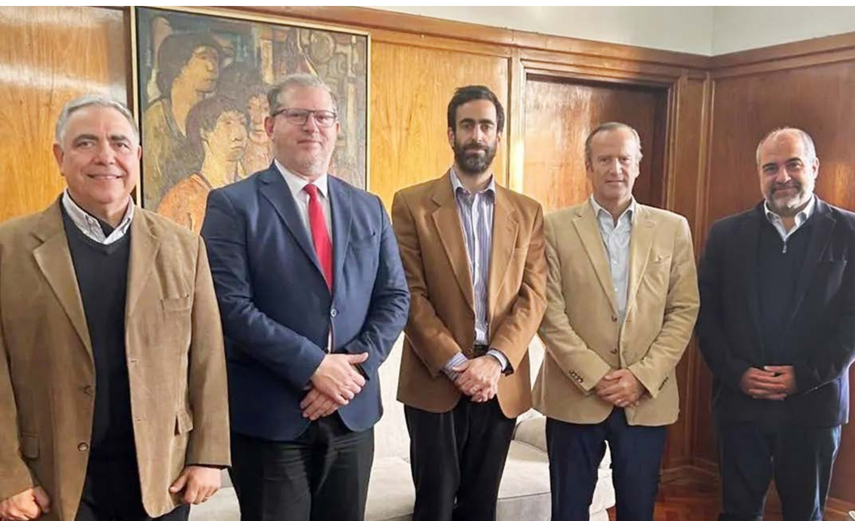
Transparencia Fiscal. Con ministro de Hacienda y miembros Lógica ONG (agosto '25)

Finalmente, propuse modificar la Ley Electoral de Mendoza N° 5.159 para habilitar la candidatura simultánea a intendente y primer concejal, ampliando opciones políticas.