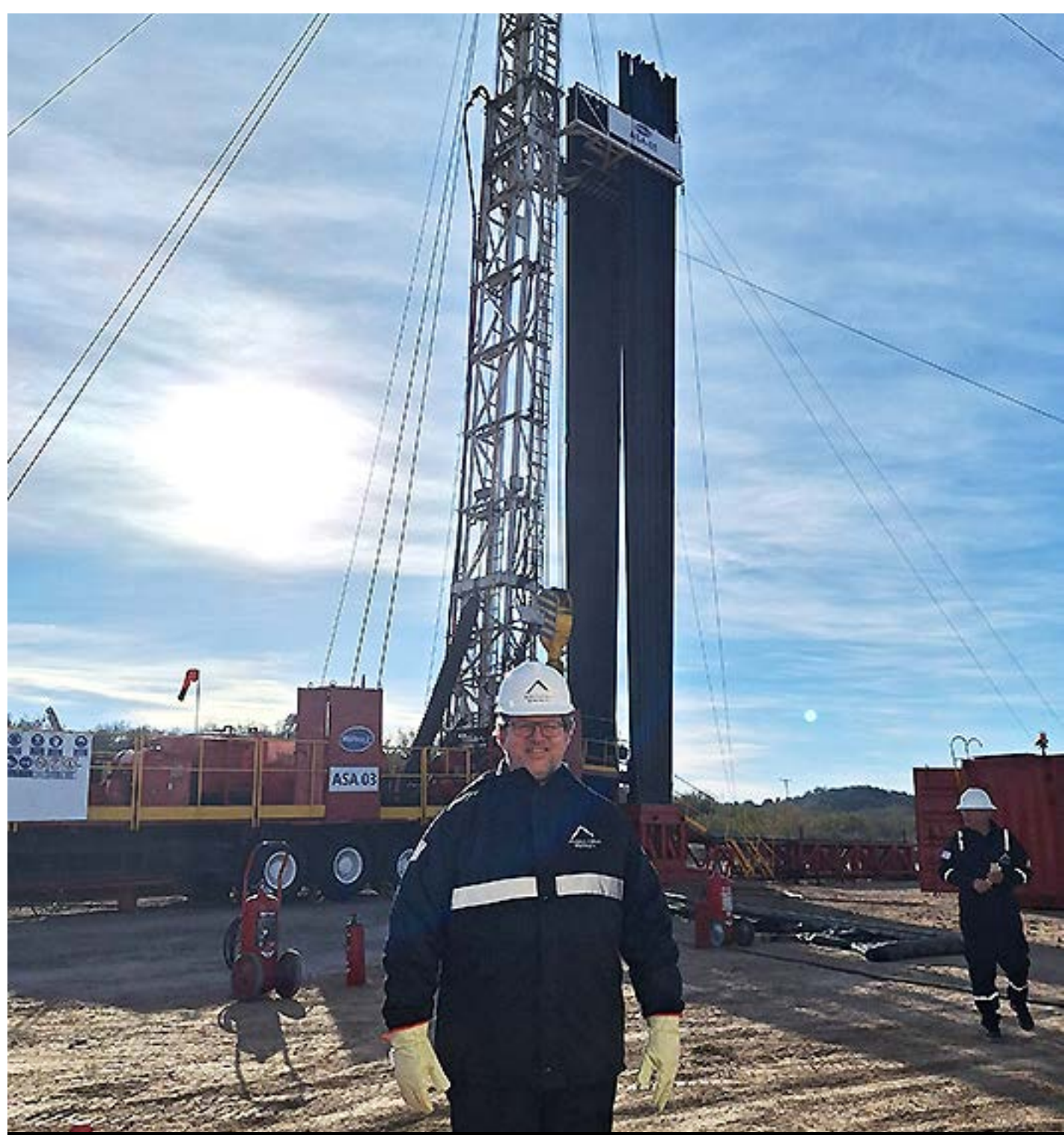
Yacimiento petrolífero Chañares Herrados, Tupungato (julio '24)