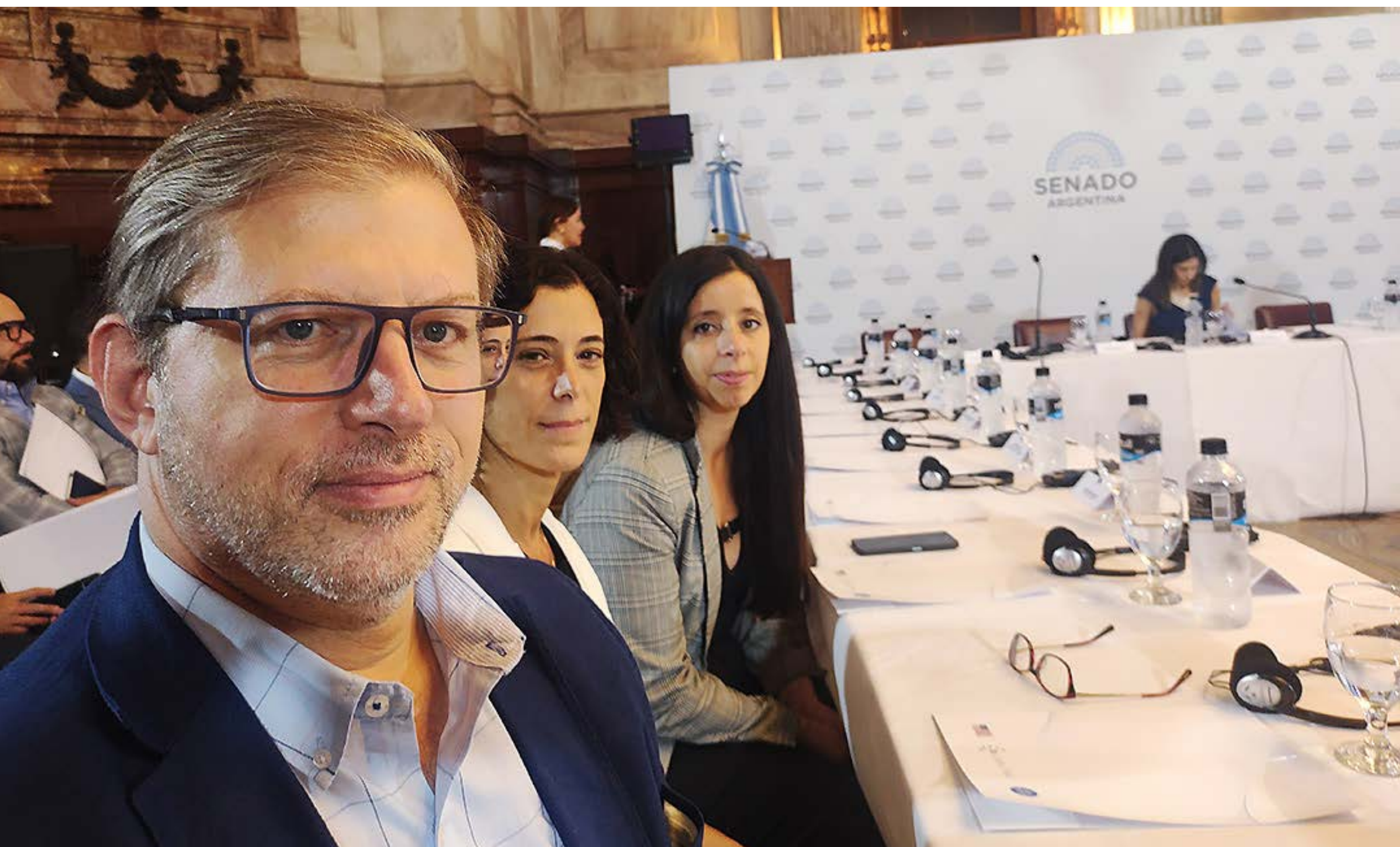
Evento Senado de la Nación, Oficinas Legislativas de Presupuesto (marzo '25)

Por otro, propuse la creación de la Oficina de Presupuesto de la Legislatura de Mendoza , como organismo autónomo del Poder Legislativo, para fortalecer el análisis fiscal, mejorar el debate presupuestario y aportar transparencia al control del gasto público.