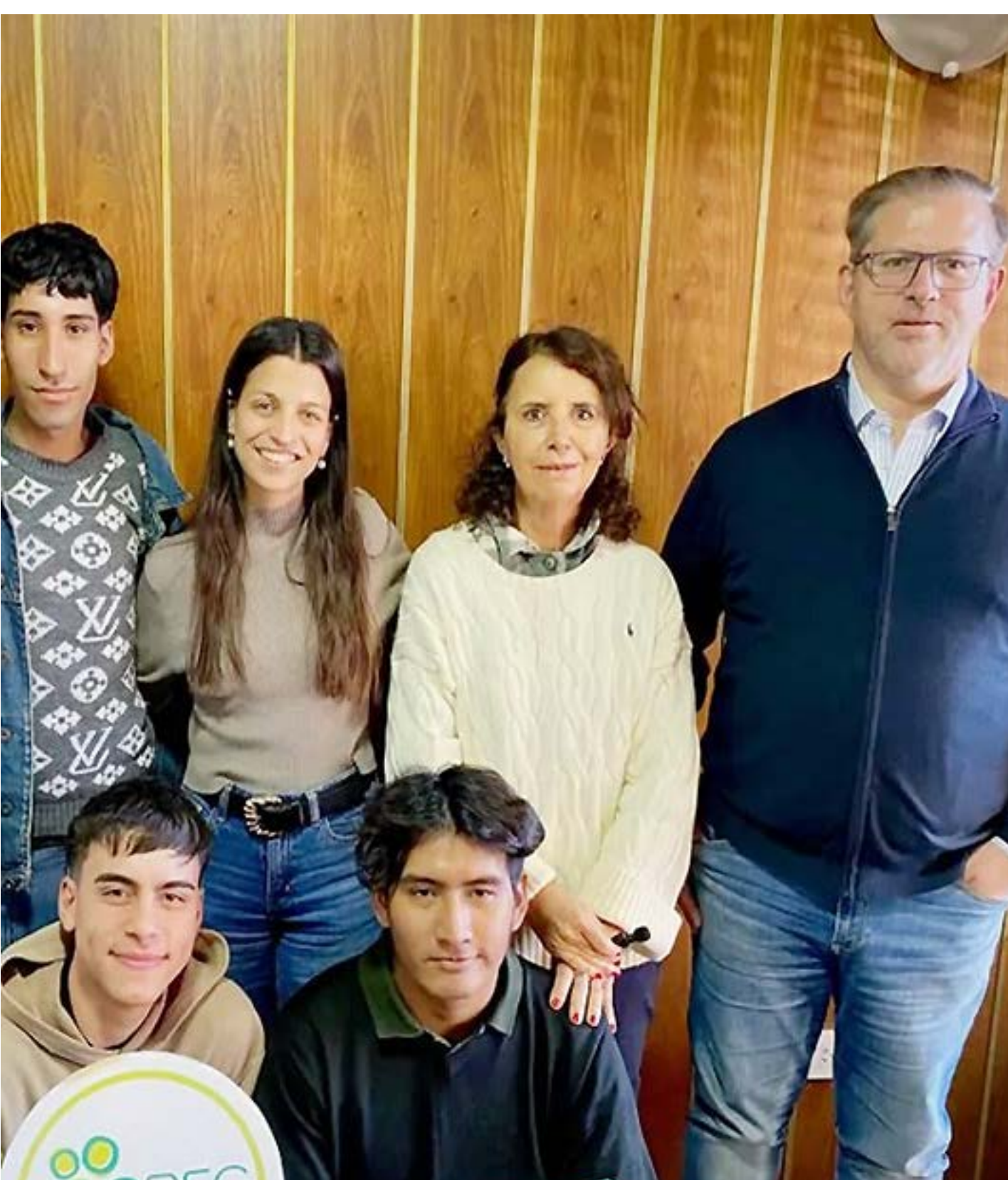
Becarios Fundación FONBEC Filial (noviembre '25)

Por un lado, propuse un régimen de incentivos fiscales para financiar becas educativas , que contribuyan en el proceso de formación de estudiantes de alto rendimiento . La propuesta plantea un esquema en el que empresas y actores productivos inviertan en capital humano, acompañen trayectorias de excelencia y ayuden a reducir barreras de acceso a la educación, en áreas estratégicas para la provincia. Además, presenté el Programa de Créditos de Honor para la Especialización en el Exterior , destinado a financiar posgrados en universidades in-